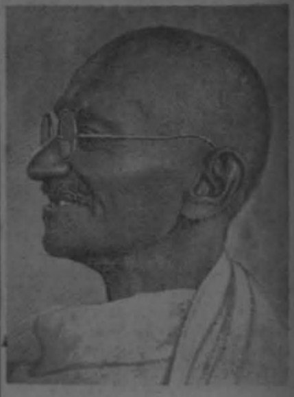
LOS PRELUDIOS DE LA INDEPENDENCIA

Varios miembros del parlamento nacionalista hindú, pidieron una entrevista con el líder jefe, creyéndose que en esa reunión se trate del cambio de impresiones adversas a la decisión de Gandhi. En todo caso, se cree que promulgada la orden de Gandhi, la desobediencia civil ha quedado definitivamente cancelada de acuerdo con los designios del líder.